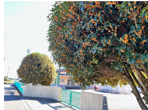
北門両脇のキンモクセイ

朝夕は、肌寒くなりましたが、日中はさわやかで心地よい季節となりました。四季の中でも、秋は暑さ寒さが程よく、過ごしやすい穏やかな季節です。今、学校では、10月27日(金)に実施される秋西祭(合唱祭)に向けて、各クラスから爽やかな歌声が広がってきています。生徒たちは、歌を通してクラスの気持ちを一つにしようと意欲的に取り組んでいます。今年度は、4年ぶりに保護者の皆様の参観も可能とさせていただきましたので、ぜひご来校いただき、生徒たちの日頃の活動の成果をご覧いただきたいと思ひます。