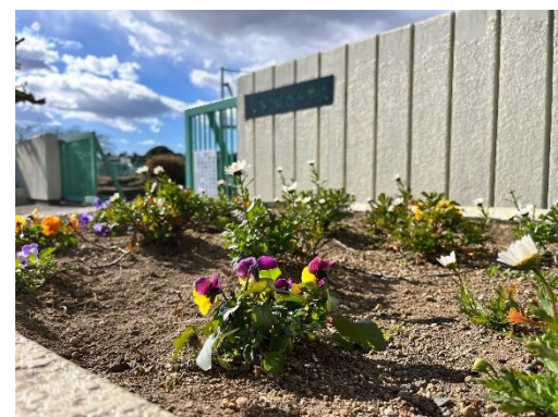
正門前のパンジーとノースポール

ここにきて急に寒さが厳しくなってきましたが、来月4日は立春です。だんだんと暖かくなり、草木が芽吹く春を迎えることは、明るい希望を見出すことにつながると考えます。本校も今年度のまとめの時期に入りました。西中学校の生徒一人一人が新しい学年への心構えをしっかりと持ち、草木が芽吹くように明るく晴れ晴れとした気持ちで新年度を迎えることができるよう、今後も支援していきたいと思います。