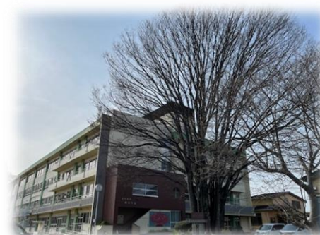
校木 「はばたきの木」

今年度、学校教育目標「共に学び 共に鍛え 共に向上する学校(三共の精神)」に向かってまいります。生徒、保護者の皆様、そして地域の皆様、どうぞよろしくお願いいたします。