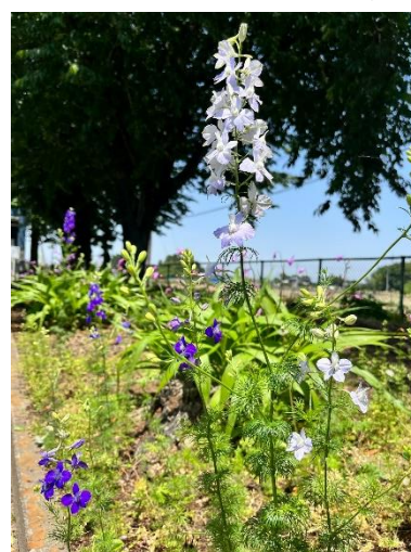
体育館前駐車場脇の千鳥草

新緑の美しい季節から、梅雨や夏の季節への変化を感じさせる時期となってきました。保護者の皆様、地域の皆様の本校教育活動へのご理解とご支援に感謝いたします。