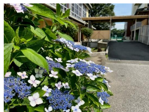
体育館脇のアジサイ

駆け足で過ごしているような1学期も、気が付くと残り1か月となりました。先日、6月3日(土)から5日(月)には、3年生の修学旅行を実施しました。前日の大雨の影響により東海道新幹線が午前中運転を見合わせとなるなど思わぬ出来事がありましたが、行程を変更しながら無事に終えることができました。また、15日(木)から17日(土)には、学校総合体育大会北足立北部班大会が行われました。4年ぶりにほぼ観客制限のない中での開催となり、多くの保護者の皆さまに応援にお越しいただき、ありがとうございました。皆様の応援を受けながら3年生を中心に「西中生としてのプライド」を胸に個人としてもチームとしても素晴らしい頑張りを見せてくれました。当日はもとよりそこに至るまでの生徒たちの努力に大きな成長を感じることができました。