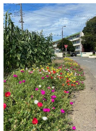
フラワーロードの「ポーチュラカ」が満開です

7月3日に、学校応援団さんたちの支援のもと、本校の通学路のフラワーロードに生徒たちが、ポーチュラカの苗を植えました。夏の暑さにも負けず、元気に育ち、今、赤、黄、白、紫、ピンクと色とりどりの鮮やかな花を咲かせています。とてもきれいですね。